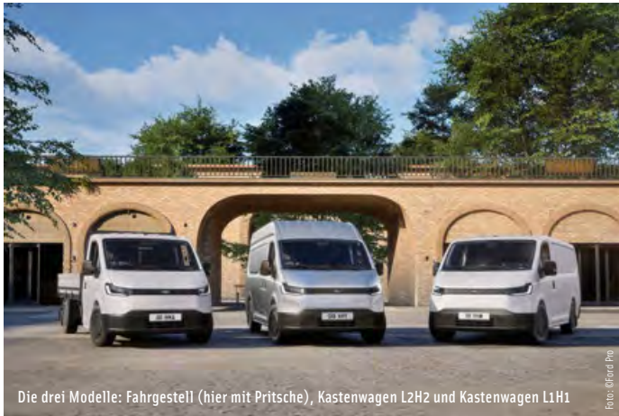
Die drei Modelle: Fahrgestell (hier mit Pritsche), Kastenwagen L2H2 und Kastenwagen L1H1

FORD ERWEITERT SEINE NUTZFAHRZEUGPALETTE UM DEN TRANSIT CITY: EIN PREISGÜNSTIGES E-NFZ ZWISCHEN TRANSIT COURIER UND TRANSIT CUSTOM.