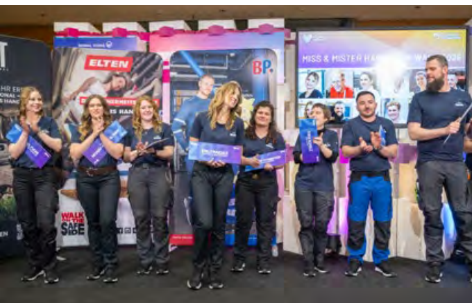
Auch wenn nur zwei den Titel tragen, alle Finalistinnen und Finalisten sind großartige Vertreter des Handwerks.